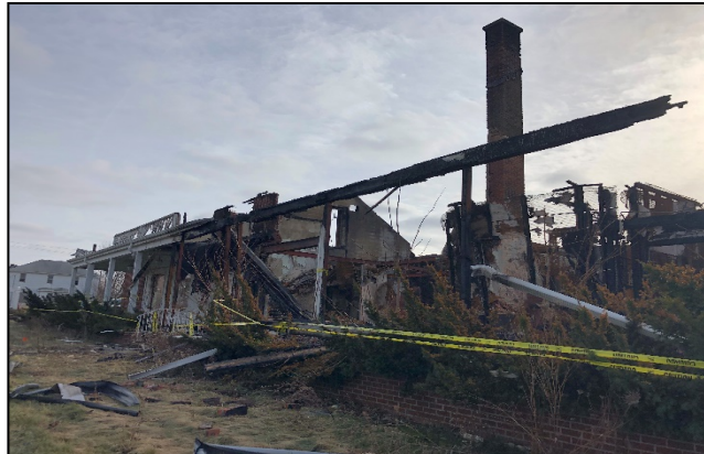
Ruinas de la antigua Funeraria Brown en 1616 Davison Road.

La Autoridad del Banco de Tierras del Condado de Genessee solicitó la ayuda de la Agencia de Protección Ambiental de EE. UU. (EPA) para remover la estructura de la antigua Funeraria Brown que quedaba luego de varios fuegos. Una investigación previa del sitio identificó la presencia de asbesto dentro de lo que ahora se ha convertido en ruinas.