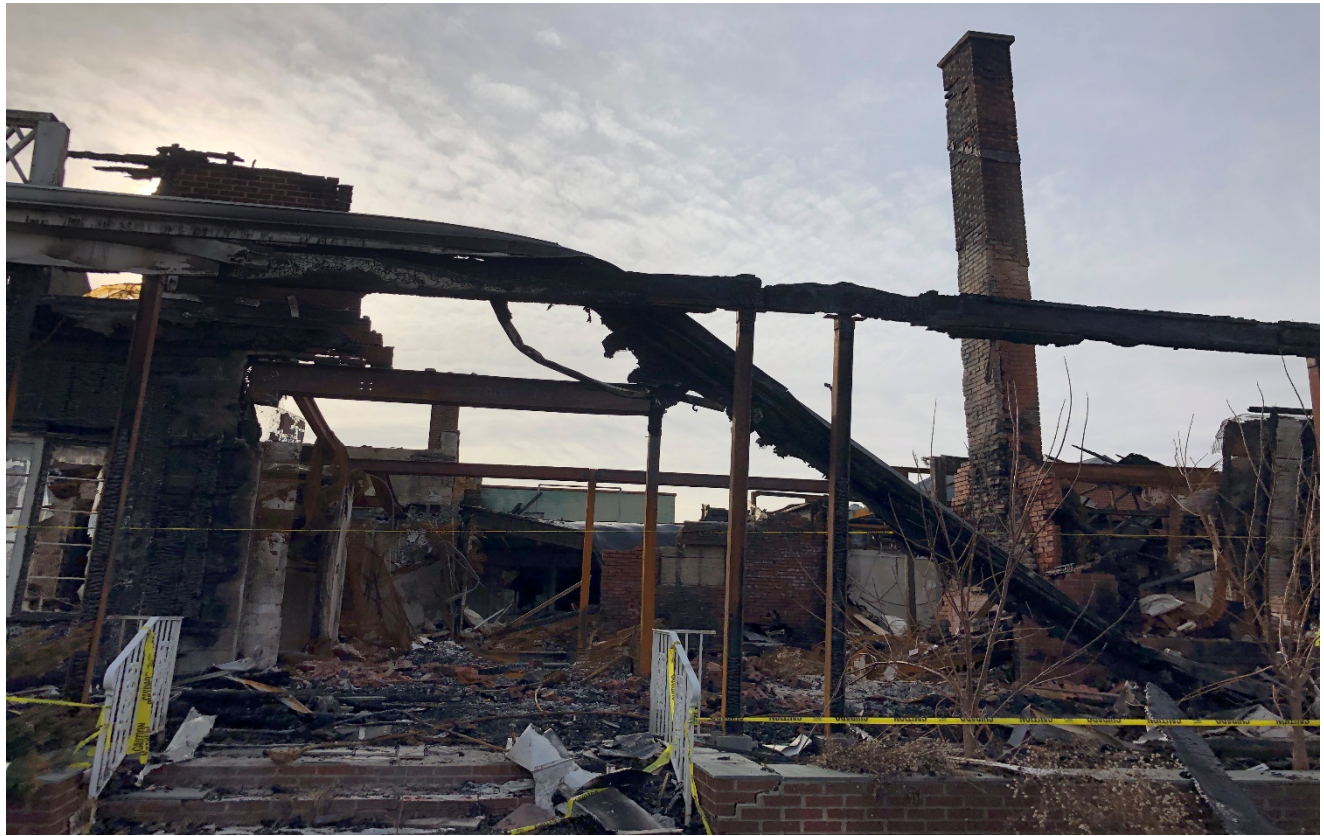
Ruinas de la antigua Funeraria Brown en 1616 Davison Road.